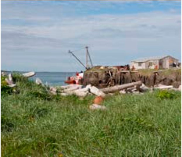
Reykjarfjörður í Arneshreppi, fámennasta sveitarfélagi landsins 2011.