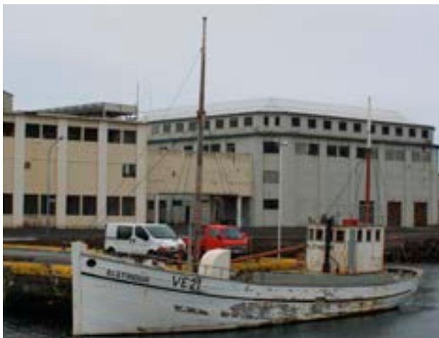
Blátindur, smíðaður í Vestmannaeyjum 1947.

bæjarstjórnir undir það. Ríkisstjórnin dró þetta frumvarp til baka og skipaði nýja nefnd til þess að ljúka málinu. Hún setti saman tillögur í tvennu lagi, hið meira og hið minna frumvarp. Minna frumvarpið var aðeins til næsta fiskveiðiárs, en hið meira miðað við alla framtíð.