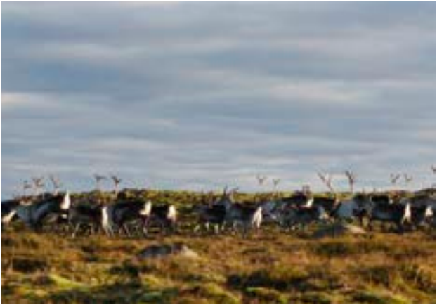
Hreindýr á veiðislóð.

Leyft var að veiða 1.001 hreindýr. – Ekki voru gerð út skip til veiða á langreyði á árinu. – Talsvert fleiri rjúpur veiddust en Náttúrufræðistofnun og Umhverfisstofnun gáfu leyfi til. Umframveiðin hefur að líkindum verið um 30%. – Fálkastofninn var talinn frekar lítill eða um 1.500 fuglar. – Við talningu á hreiðrum dílaskarfs reyndust þau vera 5.250, öll við Breiðafjörð. Alvarlegt ástand er á ýmsum tegundum sjófugla og er talið að stuttnefju hafi fækkað um 24% á ári í Látrabjargi og álku um 20%. Mikið hefur fækkað í lundastofninum, einkum á Suðvesturlandi, þ.á m. í Vestmanneyjum. Verst er ástandið á kríunni en kríuungar komast ekki á legg fyrir fæðuskorti. Um 90% af kríuungum á stóru vörpunum á Snæfellsnesi hafa drepist. – Fátt var um holugeitunga um sumarið. Er það talið eiga rætur að rekja til hruns sem varð í stofninum haustið áður. – Eyruglur eru orðnar hér varanlegur varpflugl. –