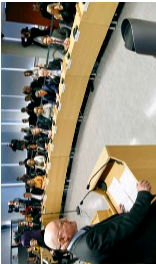
Ómar Ragnarsson ávarpar stjórnlagaráð við setningu þess, 6. apríl 2011.