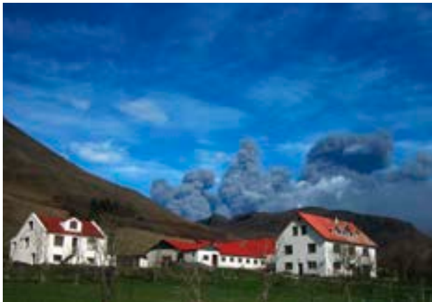
Gosmökkur yfir Skálabæjum undir Eyjafjöllum.

en mest í Krýsuvík. – Á sama svæði varð annar jarðskjálfti 2. mars, 3,7 að styrkleika. – Jarðskjálftavirkni var nokkur undir Eyjafjallajökli dagana fyrir eldgosid. — Jarðskjálfti, 2,6 stig á Richter, mældist í Kötlu 13. júlí. – 16. ágúst varð svo jarðskjálfti upp á 3,7 stig á Richter 2,6 km frá Grindavík.