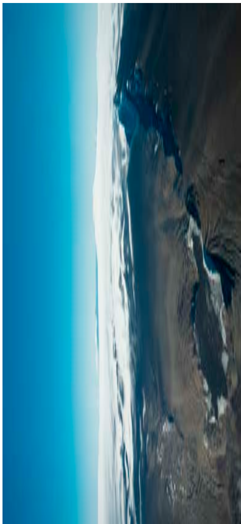
Grímsvatnaeldstöðin í september 2011.